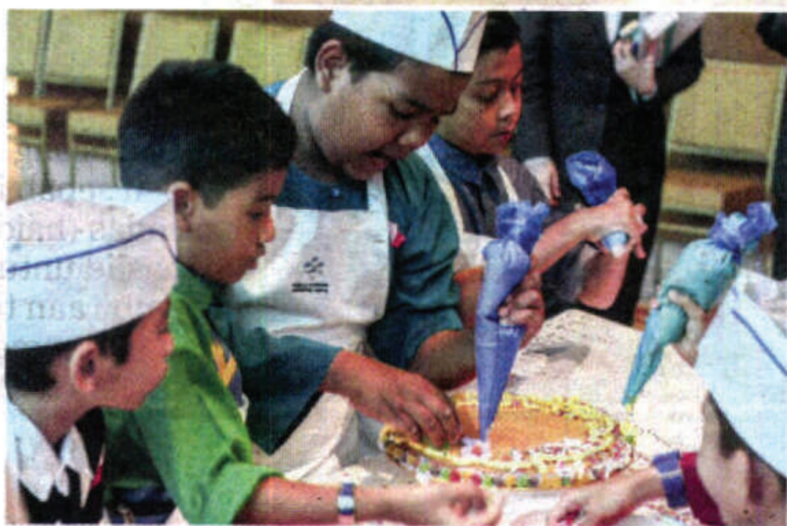
TOPI, apron dan bahan-bahan menghias biskut raya disediakan untuk digunakan para peserta.

orang dalam satu kumpulan. Setiap kumpulan diberikan masa 15 minit untuk berkongsi idea dengan melukis hiasan biskut mereka di atas kertas putih terlebih dahulu.