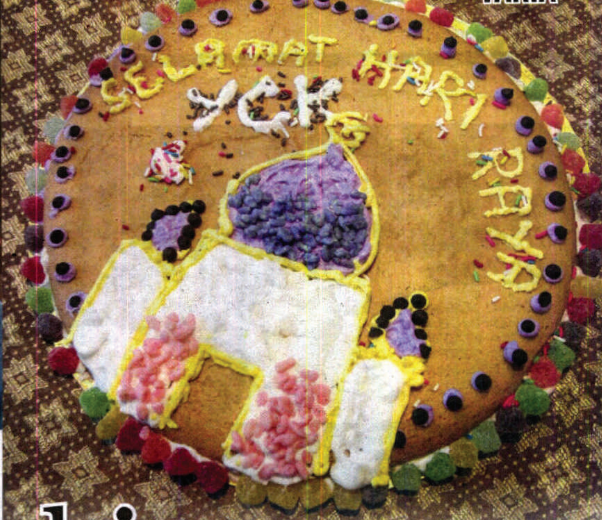
CORAK masjid pada biskut ini mencuri tumpuan ramai.