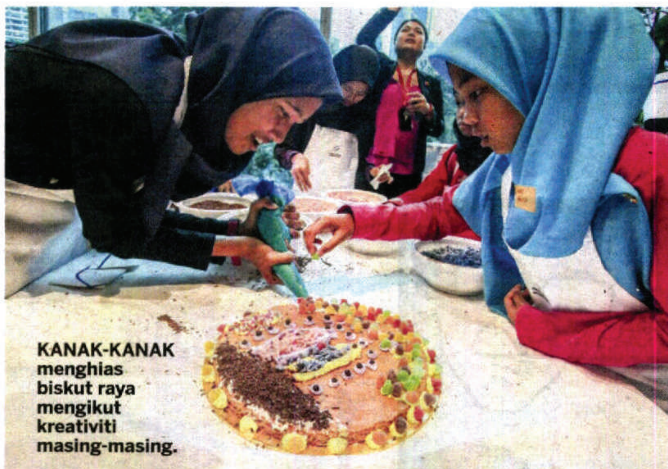
KANAK-KANAK menghias biskut raya mengikut kreativiti masing-masing.

Bagi melakukan aktiviti itu, kanak-kanak berkenaan dibahagikan kepada lapan