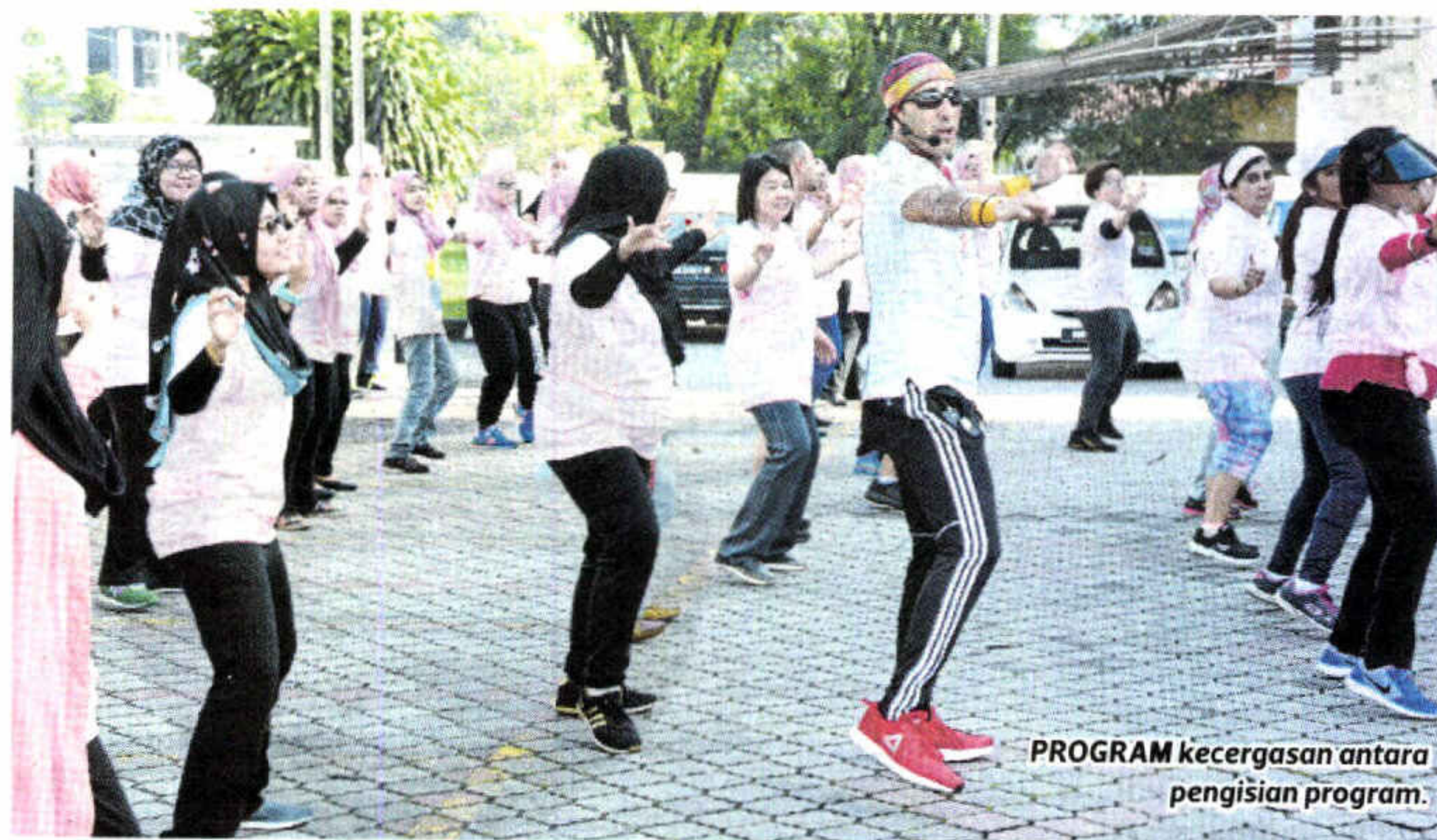
PROGRAM kecerdasan antara pengisian program.

"Selain itu, bahan merkuri yang kerap digunakan dalam kosmetik juga menyebabkan masalah