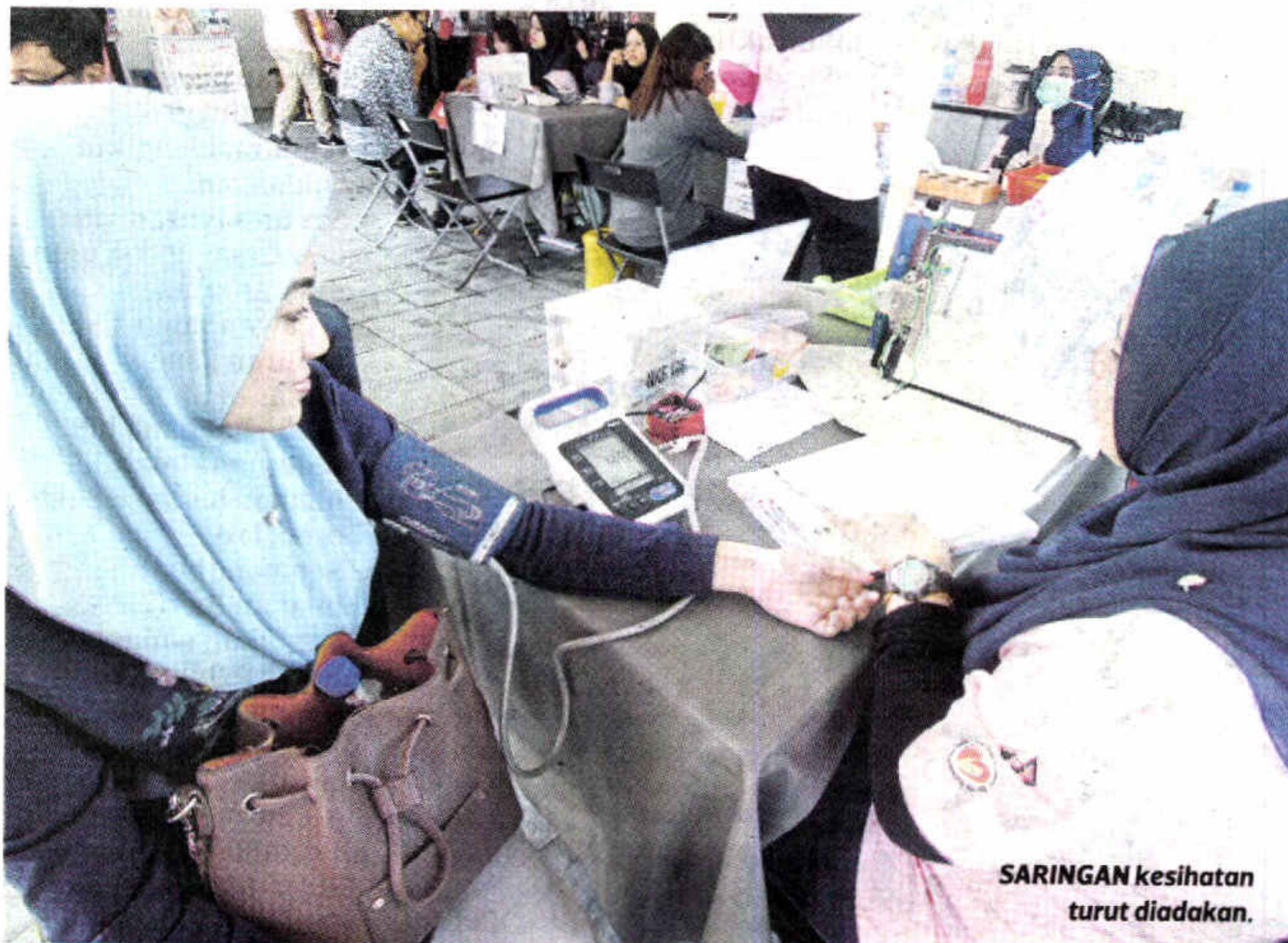
SARINGAN kesihatan turut diadakan.

Katanya, kesihatan perlu dihargai kerana kos yang perlu ditanggung tidak murah, malah membebankan bukan saja diri sendiri malah keluarga dan orang tersayang.