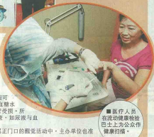
医疗人员在流动健康检验巴士上为公众作健康扫描。

“基金会每年花费70%的开销, 作为各种洗腎计划的开销, 其次花费最高的则是醒觉教育计划。” (CLL)