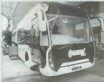
●主办单位特别准备了一辆救护车，现场为公众提供医药咨询服务。