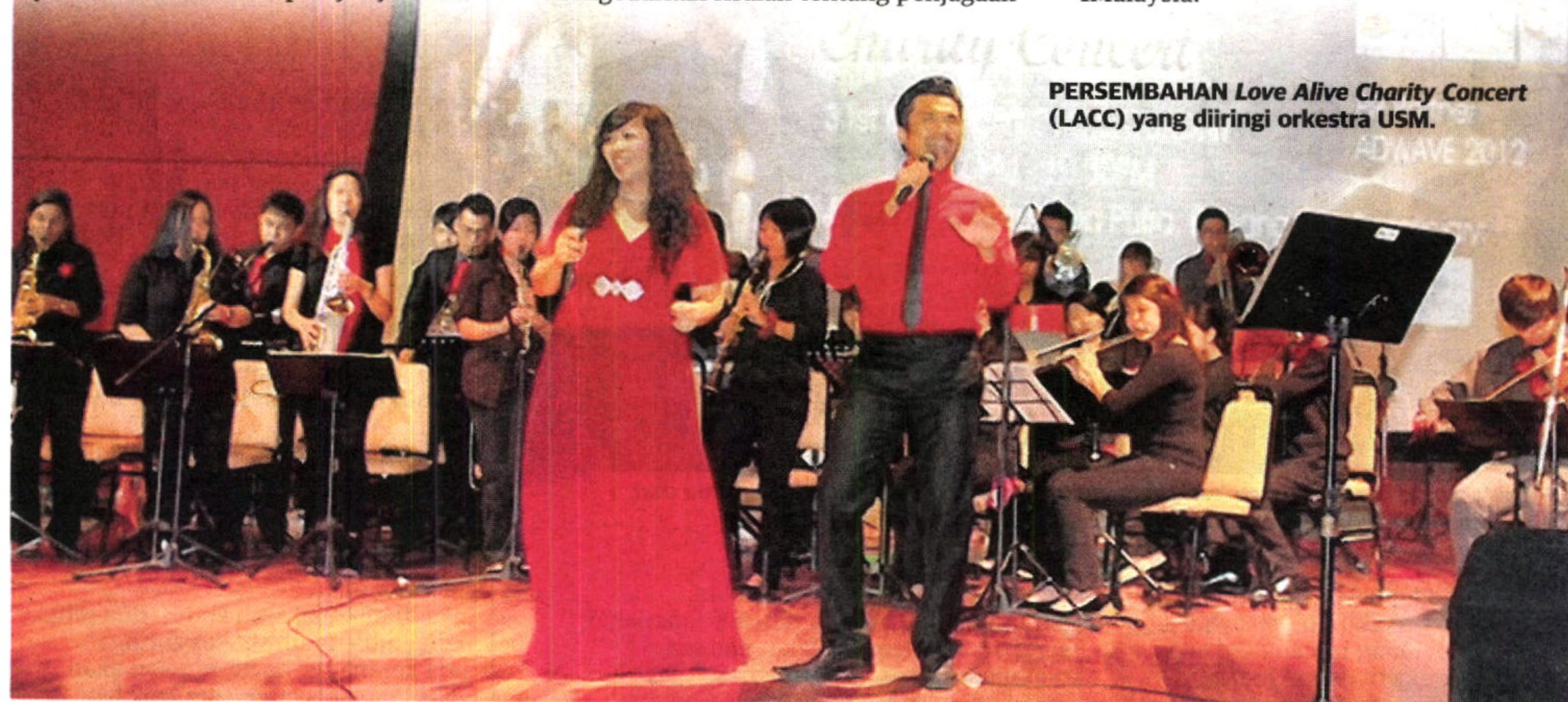
PERSEMBAHAN Love Alive Charity Concert (LACC) yang diiringi orkestra USM.

Para penonton juga menyaksikan persembahan Pride of Malaysia yang melambangkan kepelbagaian budaya 1Malaysia.