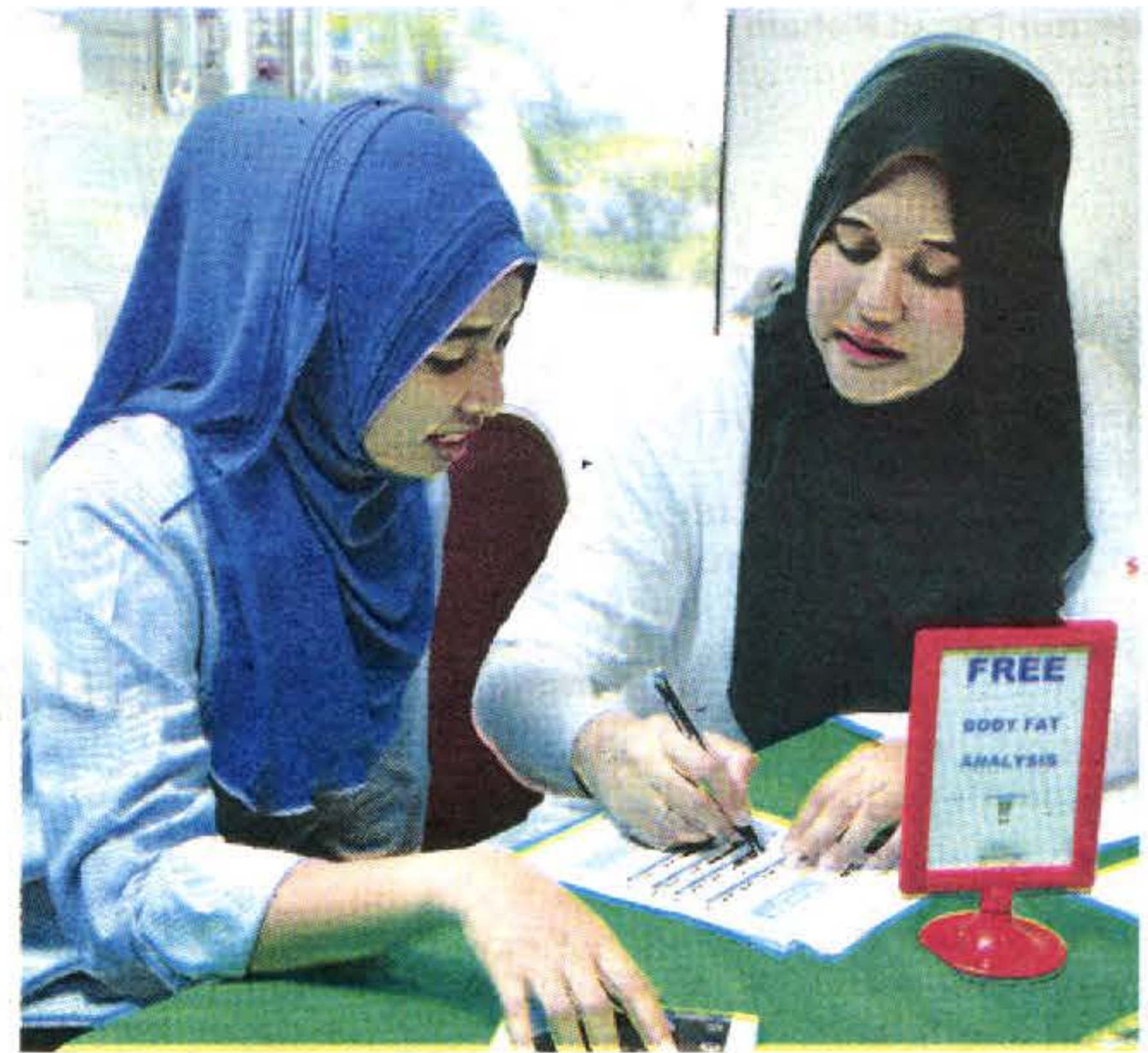
KAKITANGAN NKF turut tawarkan analisis lemak badan kepada setiap peserta program saringan kesihatan.

datapi 38 peratus lelaki dan 44 peratus wanita Orang Asli mengalami masalah obes. Kira-kira 30 peratus peserta menunjukkan keputusan tahap glukosa darah dan ujian air kencing yang tidak normal manakala 39 peratus lagi mempunyai tekanan darah tidak normal yang memerlukan pemeriksaan lanjut.