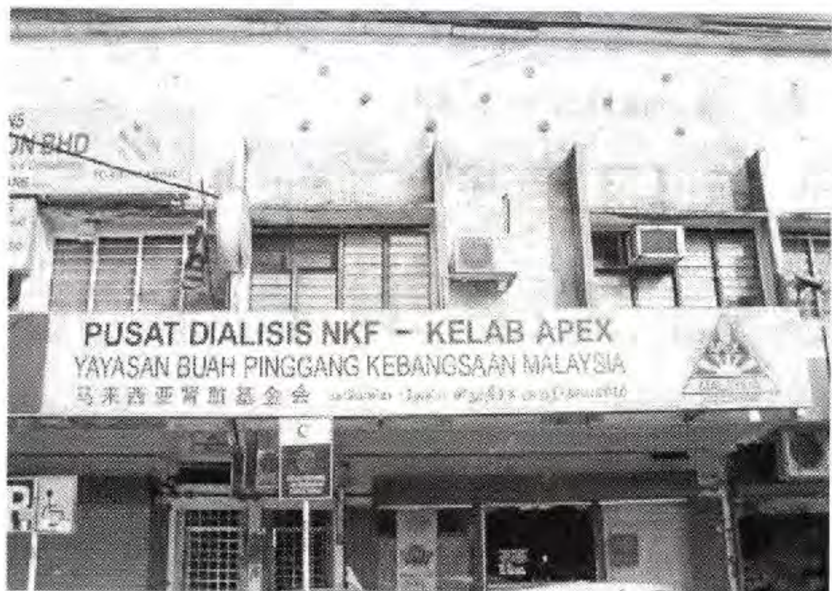
位于中路的马来西亚肾脏基金会巴生分行洗肾中心，目前还有 33 个空位开放给肾病人洗肾。

任何疑问可联络 03-3341 7009 或传真 3341 8009，或联络纳兰 012-618 8280。地址是：2100Meru, Kawasan 17 Klang。