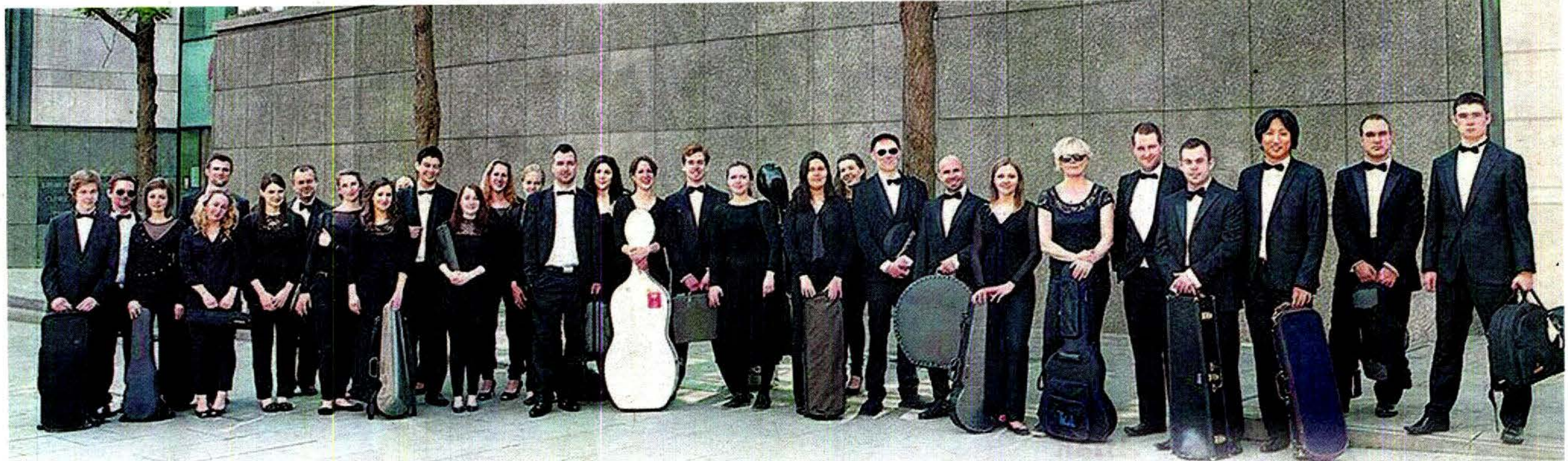
COVENT Garden Soloist Orchestra yang cukup berpengalaman dalam muzik orkestra akan membuat persembahan di malam gala Konsert Toyota Classics tahun