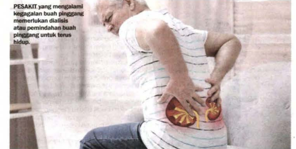
PESAKIT yang mengalami kegagalan buah pinggang memerlukan dialisis atau pemindahan buah pinggang untuk terus hidup.

Selain itu, salah satu strategi utama perkongsian itu juga dapat meningkatkan utiliti klinikal KFRE dengan mengintegrasikannya ke dalam laporan makmal.