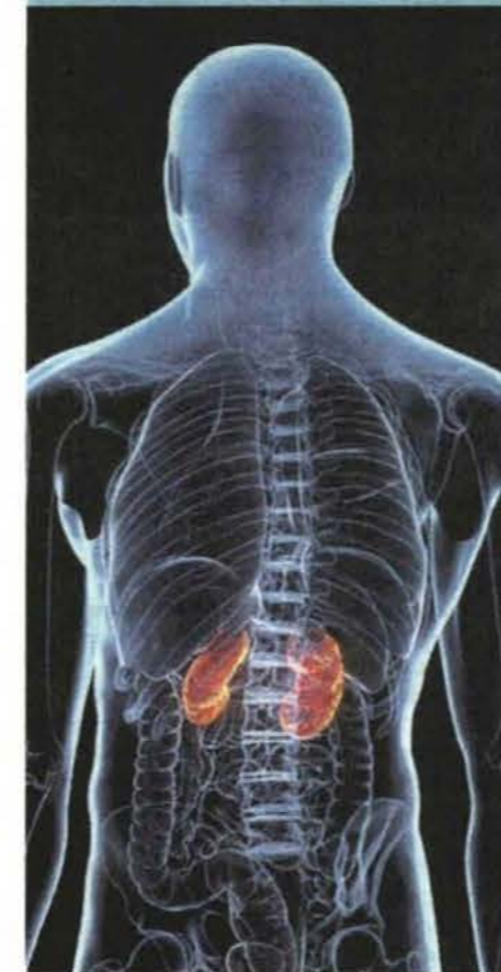
KEGAGALAN buah pinggang berfungsi dengan baik hingga menyebabkan ia semakin kronik disifatkan antara penyakit yang menjadi pembunuh senyap.